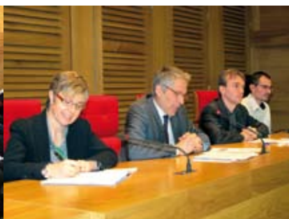
La manifestation s'est tenue dans les locaux de la CAPI.