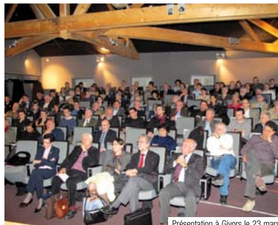
Présentation à Givros le 23 mars.

L'élaboration de ce riche travail a été guidée par deux questions : comment aborder ensemble, à l'échelle de la région urbaine, les grands changements (économiques, sociaux, environnementaux) qui se dessinent et comment s'y préparer ? Dans cette volonté commune et partagée d'aller de l'avant et de se donner, dès maintenant, un temps d'avance, ce qui frappe l'auditeur des conférences ou le lecteur du livre, c'est la nature des pistes