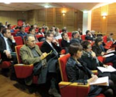
Près de 80 personnes ont assisté aux 1 ères Rencontres de l'OMPREL.

Retrouvez tous les documents OMPREL en cliquant ici .