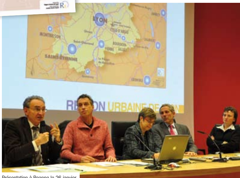
Présentation à Roanne le 26 janvier.