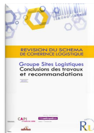
Document produit par le groupe de travail Sites Logistiques

Date à retenir : mercredi 14 mai 2014 matin dans les locaux de la CCIR