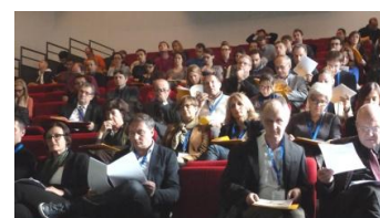
Journée du 6 novembre consacrée à la réhabilitation des façades XXe siècle

Conservation, réhabilitation, adaptation aux évolutions (normes, accessibilité, développement durable, modes de vie...) sont les problématiques auxquelles se trouve confronté le patrimoine bâti du XXe siècle. L'éventail des acteurs institutionnels ou privés confrontés aujourd'hui ou demain à ces questions appelle une approche transversale. C'est l'enjeu auquel répond le réseau « Patrimoine 21 », initié en 2012 avec l'appui de la RUL.