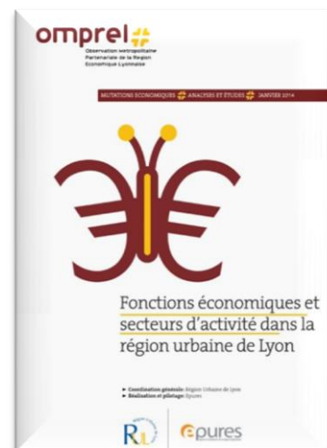
Nouvelle production de l'OMPREL