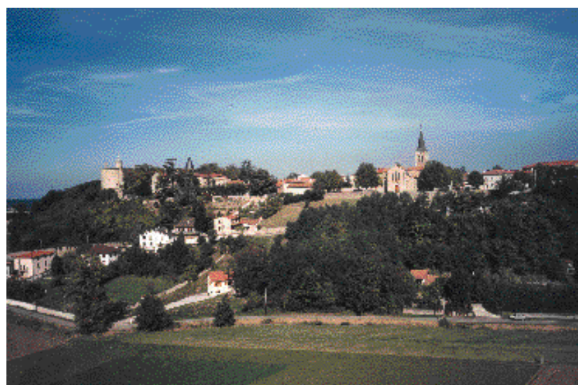
Des caractères paysagers à préserver : balme de Bouthéon