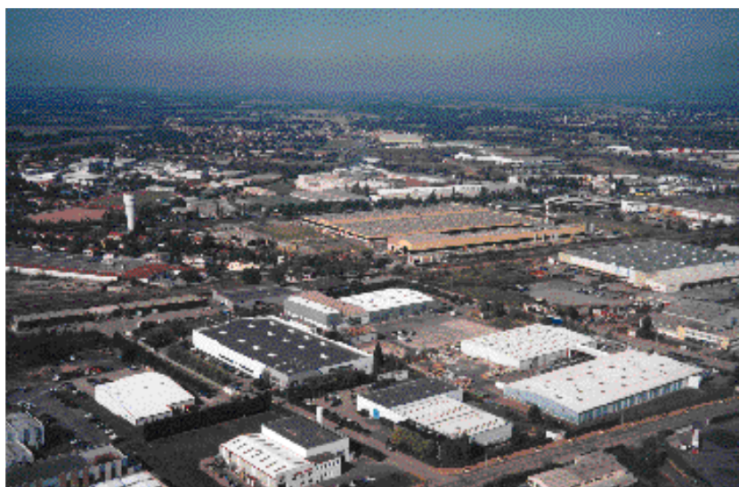
Zone industrielle Sud d'Andrézieux-Bouthéon : première génération de sites d'activités dans la plaine du Forez