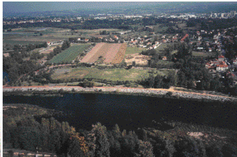
Zone de loisirs au bord de la Loire

Crédit photos : Mairie d'Andrézieux-Bouthéon / M. Genet - Conseil - Epures (Agence d'urbanisme de la région stéphanoise) - Conception, réalisation : Nouvelle Route - Juin 2000