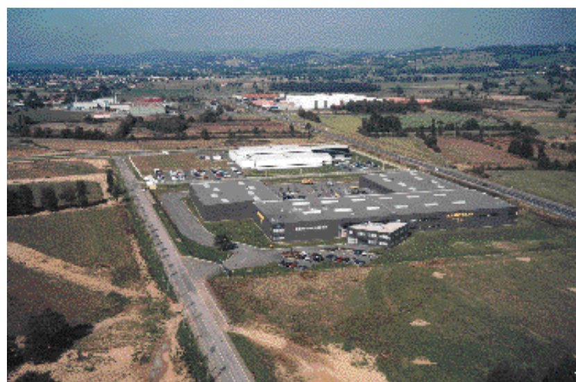
Nouvelles implantations industrielles dans l'Est de la plaine du Forez