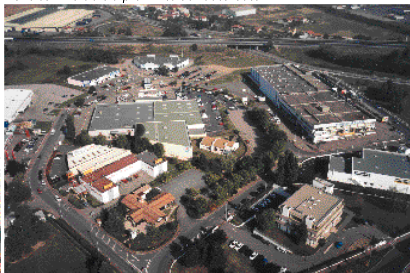
Zone commerciale à proximité de l'autoroute A72