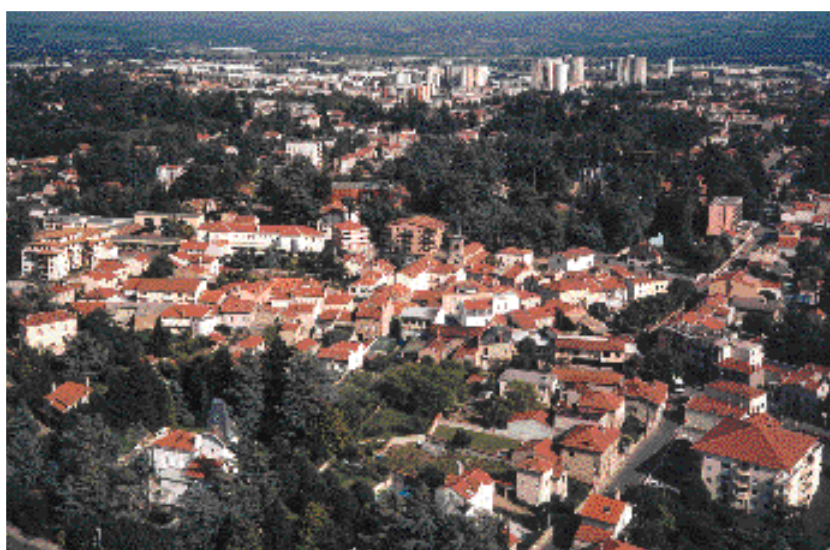
Une diversité d'unités de vie et de formes urbaines : le bourg traditionnel d'Andrézieux voisinant avec le quartier dense de la Chapelle