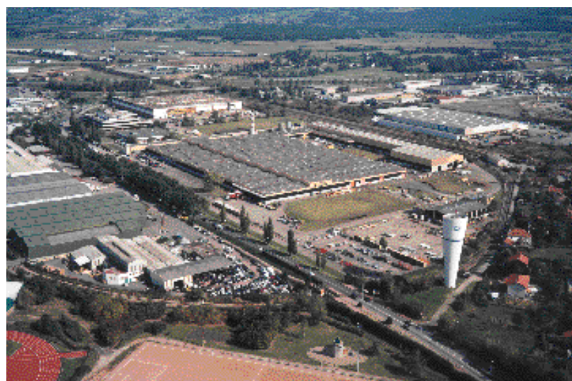
La plaine du Forez : une zone d'accueil privilégié de grandes entreprises de production