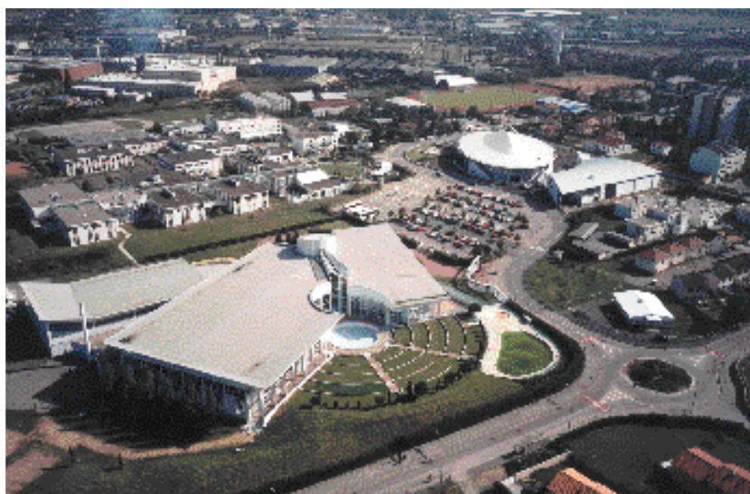
Andrézieux-Bouthéon : un nouveau pôle d'équipements scolaires, sportifs et culturels