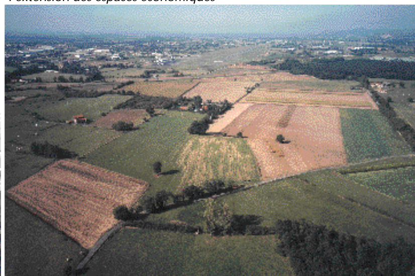
Sud-Est de l'aéroport : des réserves foncières stratégiques pour l'extension des espaces économiques

Credit photos : Mairie d'Andrézieux-Bouthéon / M. Genet - Conseil - Epures (Agence d'urbanisme de la région stéphanoise) - Conception, réalisation : Nouvelle Route - Juin 2000