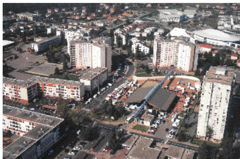
Place du marché au cœur du quartier de la Chapelle, ensemble d'habitat collectif né de la croissance urbaine périphérique des années 70