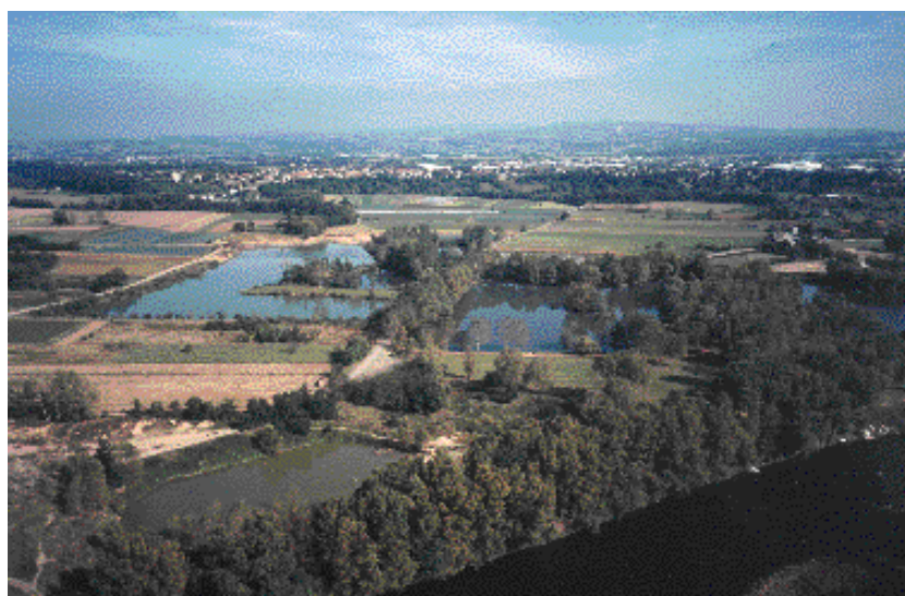
Milieux d'intérêt écologique aux abords de l'urbanisation : anciennes gravières sur la rive de la Loire