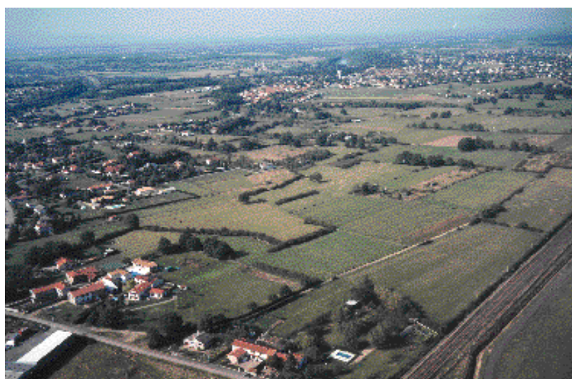
Trame agricole bocagère résiduelle entre Andrézieux-Bouthéon et Veauche